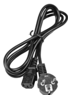
Cavo di alimentazione 230 V (pin IEC C13)